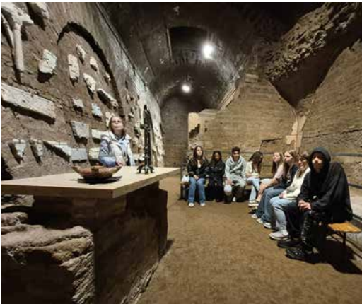
In den St. Domitilla-Katakomben

Über ihre Erlebnisse und Eindrücke berichten die Ministranten im Buttikoner Teil mit ihren Tagebuchnotizen und entsprechenden Fotos gleich selbst.